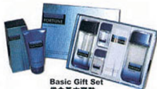
Basic Gift Set 俊念基本套裝