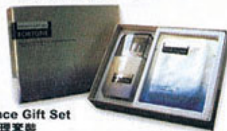
Eye Essence Gift Set 俊念眼部護理套裝